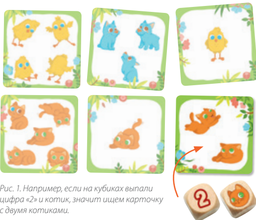
Рис. 1. Например, если на кубиках выпала цифра «2» и котик, значит ищем карточку с двумя котиками.

«Я в домике!» — командная игра, поэтому все участники считаются победителями, когда зверят удалось завести домой, и на поле не осталось ни одной карточки.