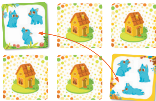
Рис. 3. Игроку в свой ход нужно открыть 2 одинаковые карточки: по количеству и типу зверят.

Игра заканчивается, когда карточек на столе не осталось. Побеждает игрок, набравший больше всех карт.