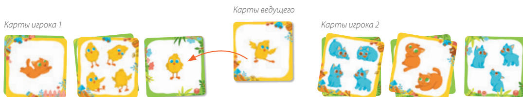
Рис. 4. Если ведущий открывает карточку, которая есть у игрока, игрок забирает эту карту и кладёт её поверх своей.

Выигрывает тот, кто первый соберёт все пары для своих карточек.